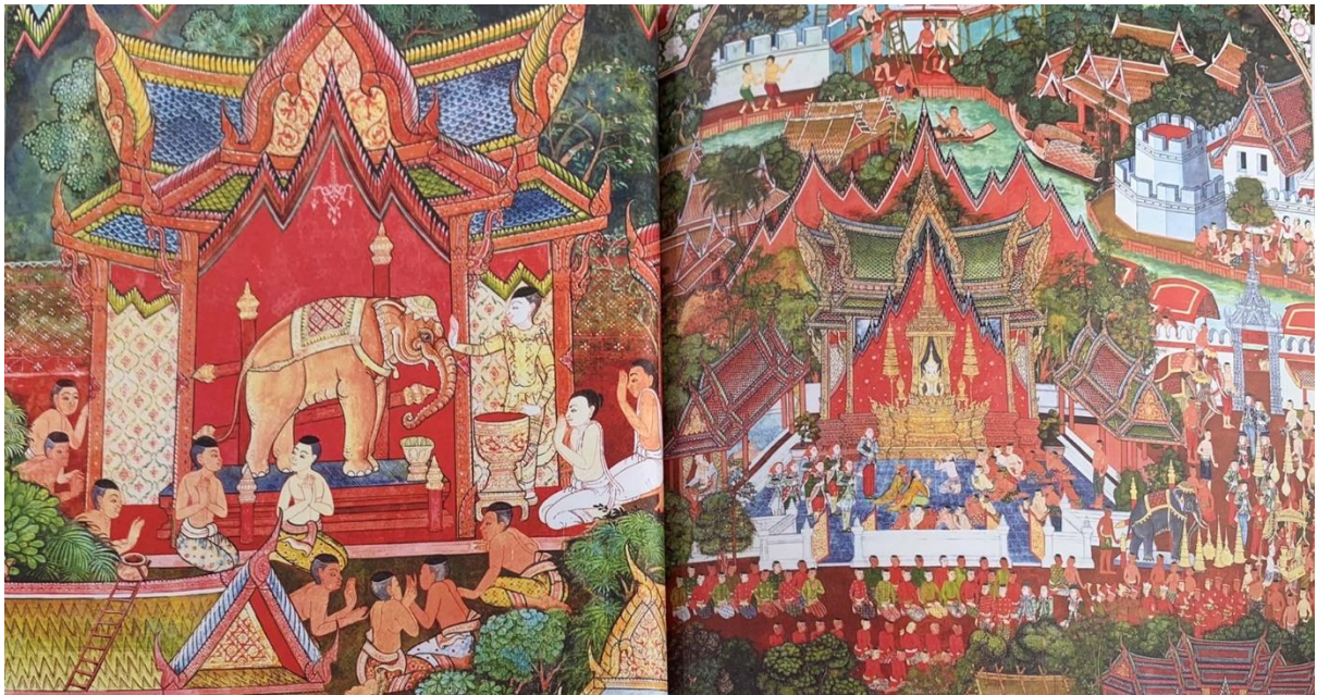
ภาพจิตรกรรมฝาผนังภายในพระอุโบสถ วัดอัมพวันเจติยาราม แสดงเรื่องราวพระราชประวัติในพระบาทสมเด็จพระพุทธเลิศหล้านภาลัย พระราชพิธีสมโภชขึ้นระวางพระยาเศวตภูษกร ช่างเผือกเชือกแรกในรัชกาล