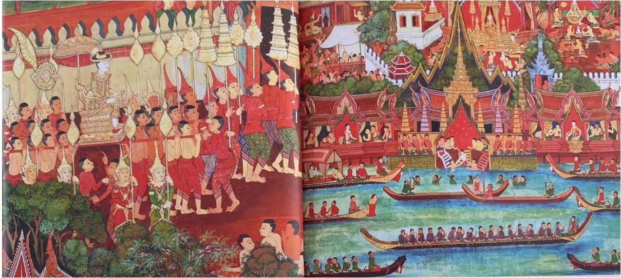
ภาพจิตรกรรมฝาผนังภายในพระอุโบสถ วัดอัมพวันเจติยาราม แสดงเรื่องราวพระราชประวัติในพระบาทสมเด็จพระพุทธเลิศหล้านภาลัย เมื่อเสร็จการพระราชพิธีอุปราชาภิเษกแล้ว กรมพระราชวังบวรสถานมงคล เสด็จลงเรือพระที่นั่ง ที่มา : กระทรวงวัฒนธรรม, จิตรกรรมผีพระหัตถ์และจิตรกรรมตามแนวพระราชดำริ สมเด็จพระเทพรัตนราชสุดาฯสยามบรมราชกุมารี วัดอัมพวันเจติยาราม (กรุงเทพฯ : รุ่งศิลป์การพิมพ์ (๑๙๗๗), ๒๕๕๙), ๙๓.